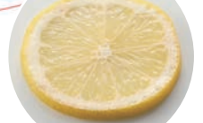
モイストエアリーを塗布したレモン