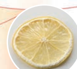
何もしていないレモン